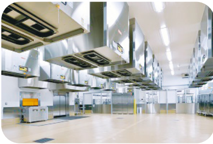
天吊り式消毒装置

さらに、食を学ぶ場として、調理作業が見学できるスペースや会議室を設けており、実際に調理作業を見て給食への関心を高めることにより、食の大切さやありがたさを感じてもらいたいと思っています。