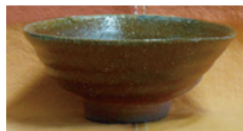
備前焼「ごはん茶碗」セット ※詳細は6ページ