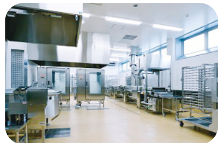
焼き物・揚げ物・蒸し物調理室