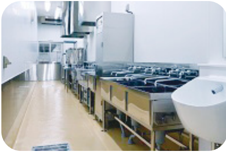
アレルギー対応専用調理室