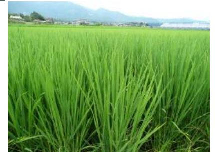
すくすく育っています