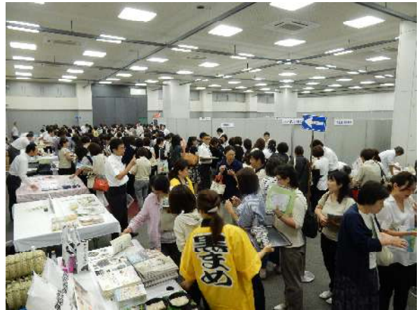
「地場産物」展示コーナー