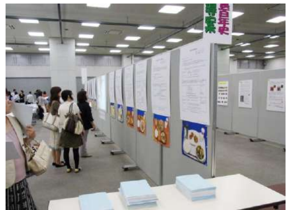
学習指導案パネルと冊子コーナーの設置