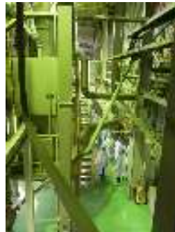
工場内はパイプばかりです