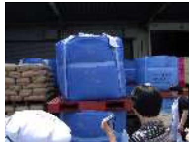
給食用の玄米です