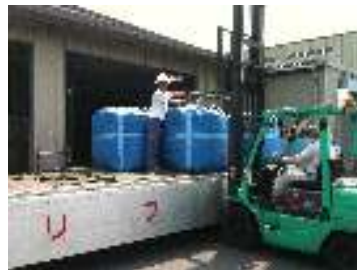
玄米が入荷していました