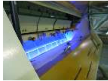
色彩選別機です（異物のみ空気ではじきます）