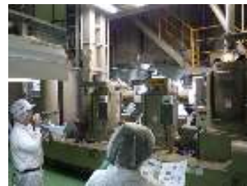
精米は精米機3台で行います