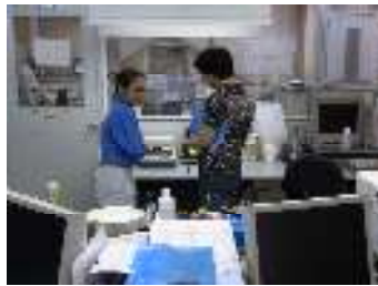
分析室（L O T毎に、味、水分、硬さ等のチェック）