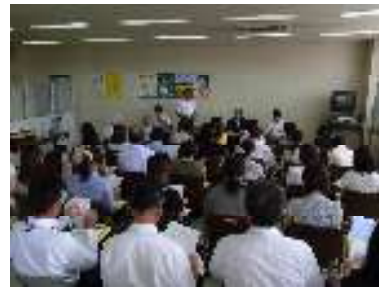
視察前の説明を聞きます