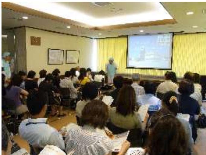
視察前の説明を聞きます 工場内は撮影禁止でした。