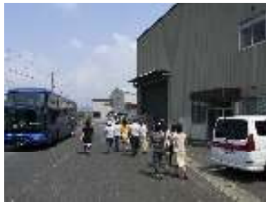
岡山パールライスに到着