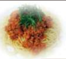
大豆ミート (ミンチ) 1kg

国産大豆100%の無添加食品で、ひき肉の代わりにご使用いただけます。肉のような食感を生かした、ヘルシー食材です。