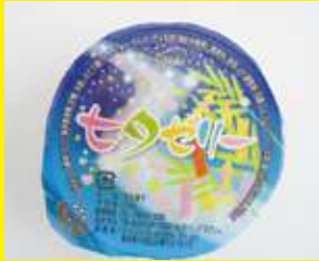
(パッケージ) 七夕ゼリー 50g