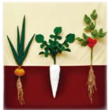
貸出品 タベストリー（Aセット） ※詳細は6ページ