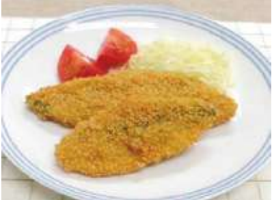
白身魚カリカリフライ 約40 g・約60 g ホキ切身に粒状のジャガイモと米粉、小麦粉で衣を付けて軽くフリフライしており、カリッとした食感が楽しめます。