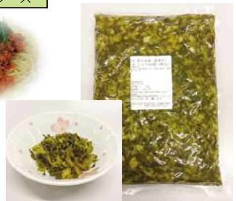
刻み高菜 (給食用) 1kg (固形量800g)

国産大豆100%の無添加食品で、ひき肉の代わりにご使用いただけます。肉のような食感を生かした、ヘルシー食材です。