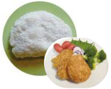
ポテトとお米のササミカツ 40 g・50 g・60 g 国産ササミにポテトフレークと米パン粉で衣付したチキンカツです。ポテトの香りと米パン粉のほどよい食感をお楽しみください。