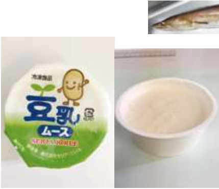
冷凍豆乳ムース 40 g ほのり甘みがあり、たんぱく質が豊富な豆乳を使用したムースです。自然解凍(半解凍)でご使用ください。