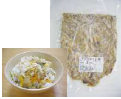
アジのほぐし身 (真空) 1 kg アジの身だけを焼き、ほぐしました。ふりかけ、和えもの、炒めもの、おにぎりの具材など幅広くご使用いただける素材です。