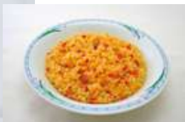
キャロットピラフ 1.1kgレトルト

人参をたっぷり使った、炊き込み用ピラフの素です。水加減は通常で7kg炊飯には2袋使用します。