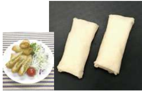
国産野菜の春巻 25 g 国産野菜をふんだんに使用し、オイスターソースで味付けをしました。また、食材で摂取しにくい鉄分と食物繊維を強化した春巻きです。