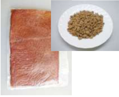
鶏レバーミンチ (真空) 1 kg 若鶏のレバーを使い勝手の良いミンチ状にしました。カレーやミートソース等に加え、鉄分強化にご使用いただけます。