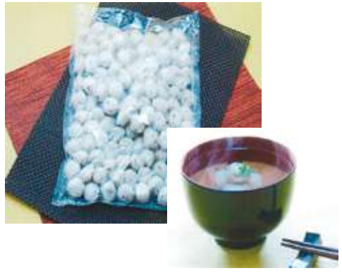
学給無リン 冷凍あかもく入りつみれ 1 kg あかもく入りのつみれです。1個約8gの大きさで、揚げもの、煮もの、汁もの等にご使用いただけます。