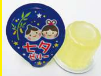
七夕ゼリーミニ (レモン味) 22g