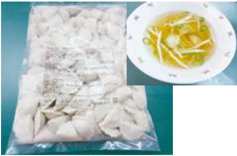
プチスープ餃子 500 g 煮んでも崩れにくい強い皮にしています。小さくても豚肉を30%以上配合した豪華な餃子です。中華スープ、ラーメンの具材としてご使用いただけます。