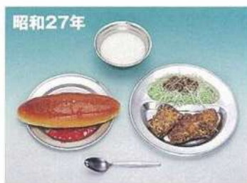
昭和27年 コッペパン・ミルク(脱脂粉乳) 鯨肉の竜田揚げ・せんキャベツ・ジャム