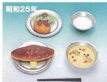
昭和25年 コッペパン・ミルク(脱脂粉乳)・ポターージュ コロケ・せんキャベツ・マーガリン