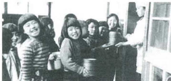
児島郡灘崎小学校のユニセフ給食 昭和24年