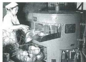
昭和28年頃の洗浄機