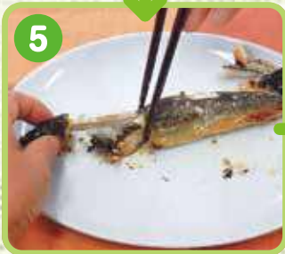
5 頭を持って 背骨を引き抜きます