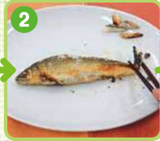
2 尾びれを折って はずします