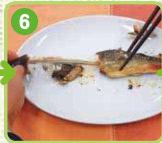
6 内臓は少しにがいが 食べる人もいます