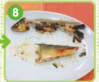
8 パクパク食べます