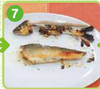
7 身だけがきれいに 残りました