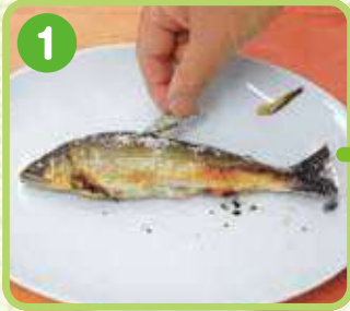
1 背びれ、胸びれ、尻びれを はずします