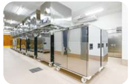
電気式天吊りコンテナ消毒装置と消毒用コンテナ