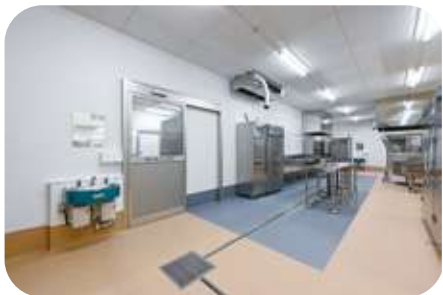
アレルギー食調理コーナー

また、調理過程で発生した残菜や残飯を粉碎処理装置で粉碎して、地下の管に送り専用機器で脱水することでゴミの軽量化を行い、食器、食缶洗浄機やコンテナ洗浄機の導入で調理員の作業量の軽減が図れるようになりました。