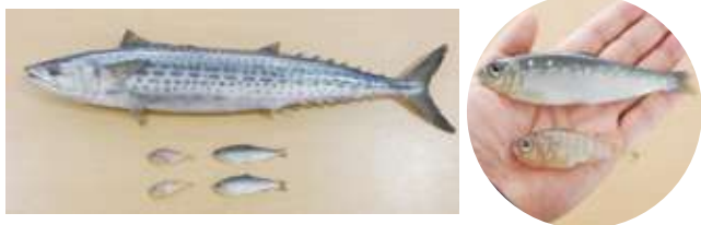
さわら、いしもちじゃこ、ままかり

また、学校給食実施現場における、調理室の微生物や残留脂肪等を検査する簡易検査器具を貸し出します。