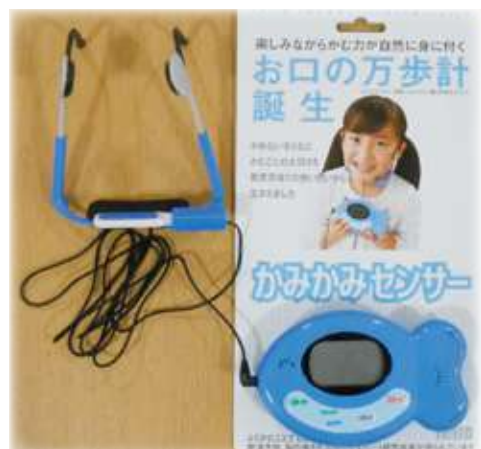
貸出品 咀嚼計かみかみセンサー ※詳細は6ページ