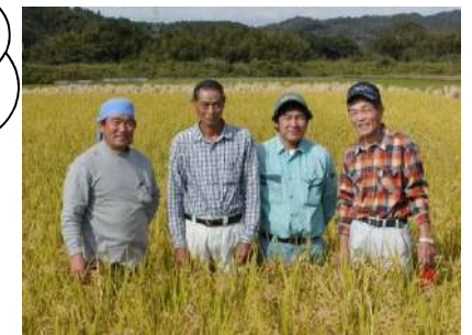
黄金色に実ったはいいぶきと 生産者のみなさん