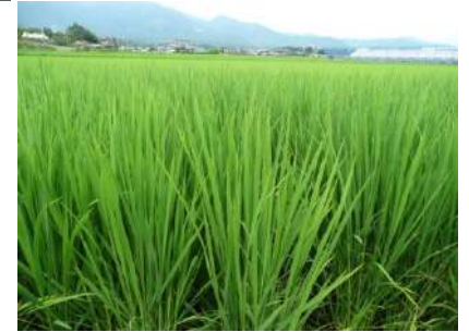
すくすく育っています