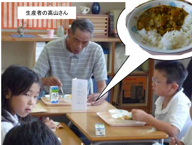
於：津山市立高倉小学校

H21年に、初めて津山市内の給食ではいいぶきが提供された時には、生産者、市長、教育長と一緒に給食を食べる会を実施しました。