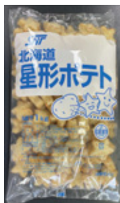
北海道星形ポテト 1kg