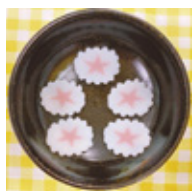
海の星型スライス なんと 160g