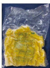
やさしい海の極細蒲鉾(黄) 1kg ※錦糸卵の代わりにご使用いただけます。