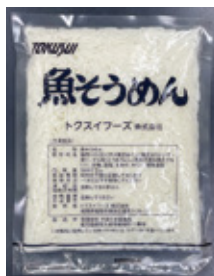
魚そうめん 500g ※いとより(魚肉)のすり身を麺にし、約7cmにカット。時間が経過しても伸びません。