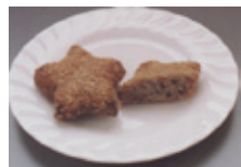
スターポークミンチカツ 40g・50g・60g