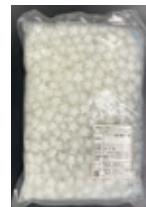
星型ナタデココ 固形量約 800g