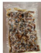
うなぎ蒲焼短冊切(真空)500g うなぎ蒲焼(真空)40g・50g