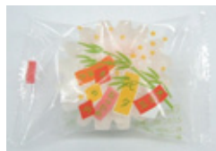
キラキラ餅(みかん)40g ※自然解凍でお召し上がりください。