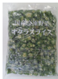
国産オクラスライス 1kg