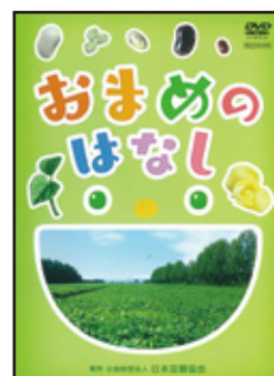
新規貸出品 DVD おまめのはなし ※詳細は4ページ