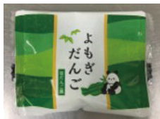
よもぎだんご(笹だんご風)27g ※自然解凍でお召し上がりください。