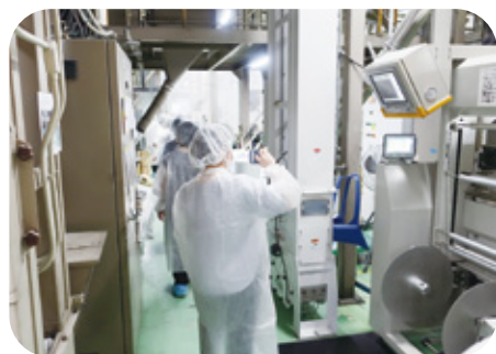
全農パールライス

参加者からは、「本日の視察がとても勉強になったので、多くの栄養教諭等に視察のチャンスがあるといいなと思った」「異物混入防止のための徹底した整理・整頓が勉強になった」「児童・生徒だけでなく職員への食育にも生かしたいと思う」等のご意見、ご感想をいただきました。