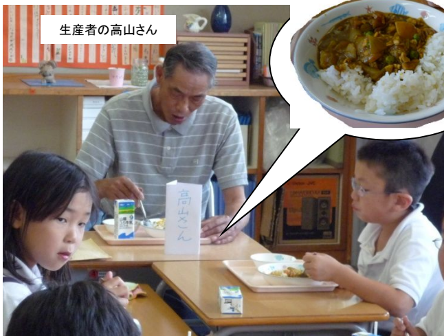
於：津山市立高倉小学校

H21年に、初めて津山市内の給食ではいいぶきが提供された時には、生産者、市長、教育長と一緒に給食を食べる会を実施しました。