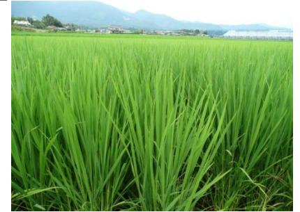
すくすく育っています